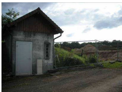
Les 1 ière photos

Les travaux ont débuté le 6 juillet 2009